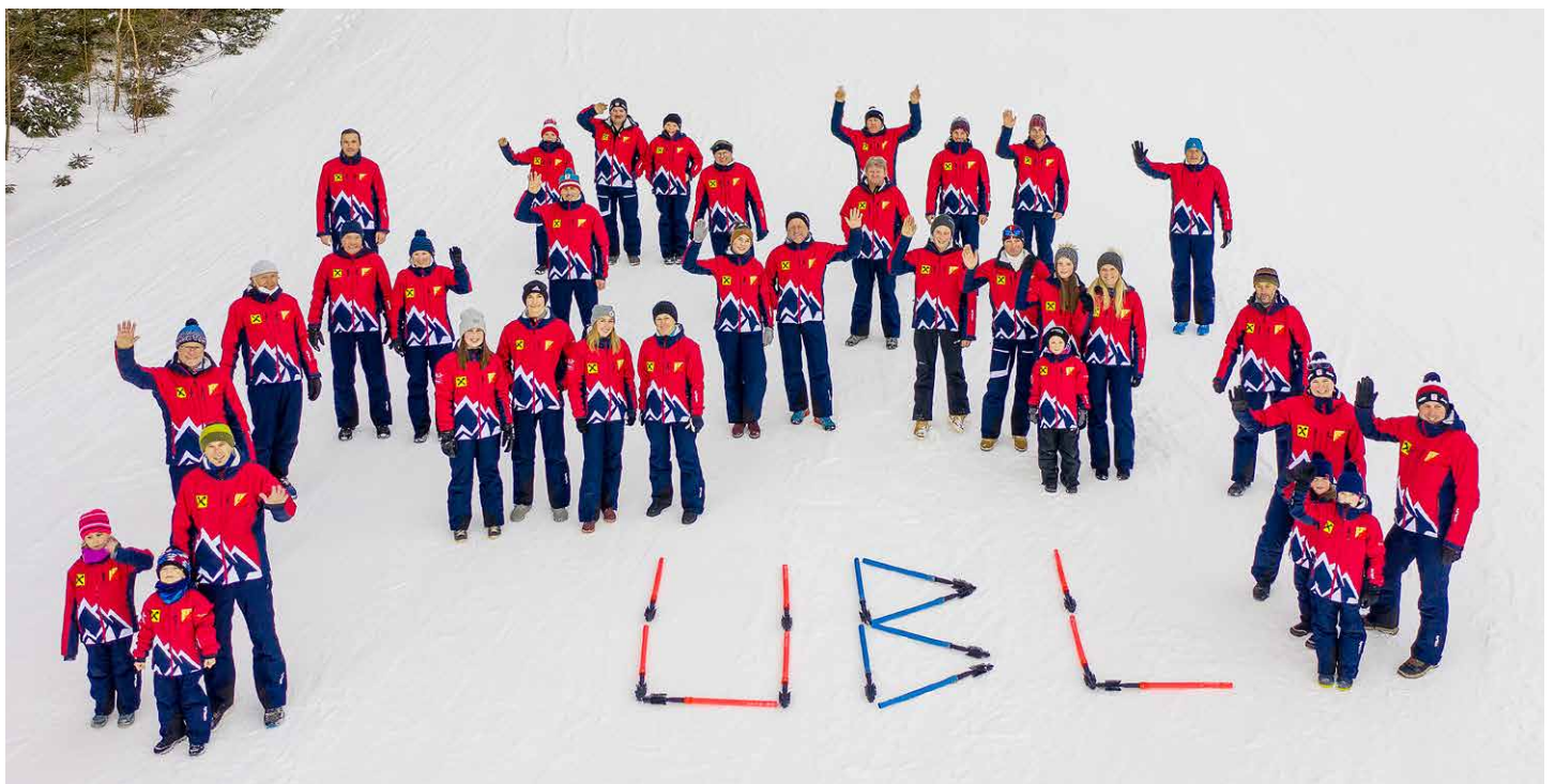
Neue Bekleidung für die Skifahrer der Union.